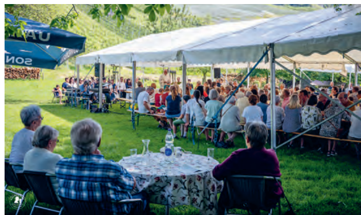
Nach 5 Jahren darf man schon von einer Tradition sprechen beim Weingottesdienst beim Rosentürmli.