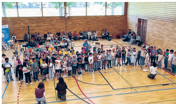
Die Jüngsten der Musikschule beim Zwerglikonzert in der Turnhalle Kugelwis in Rheineck.