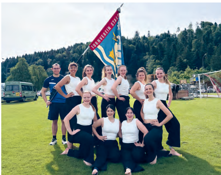
Gymnastikgruppe – Tannenzapfen-Cup 2026