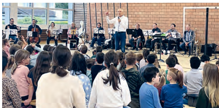
Die Schulhauskonzerte begeisterten zahlreiche Schüler:innen

Mit den Schulhauskonzerten erreichte die Musikschule Am Alten Rhein sämtliche Schüler:innen der 1. bis 4. Klassen in den drei Mitgliedsgemeinden Thal, Rheineck und St. Margrethen. Im Zentrum stand ein Minimusical nach «Peter und der Wolf» von Sergej Prokofjew, mit dem die verschiedenen Instrumente der Musikschule vorgestellt wurden. Die jungen Zuhörer:innen erhielten einen lebendigen Einblick in die Klangwelt der Instrumente und konnten Musik unmittelbar erleben. Die öffentlichen Aufführungen machten zugleich die Vielfalt des Unterrichtsangebots sichtbar.