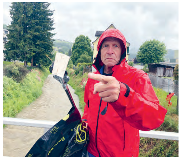
Ein Bach Böllä Putzer in vollem Einsatz

Man darf also gespannt sein – und Petrus hoffentlich auch.