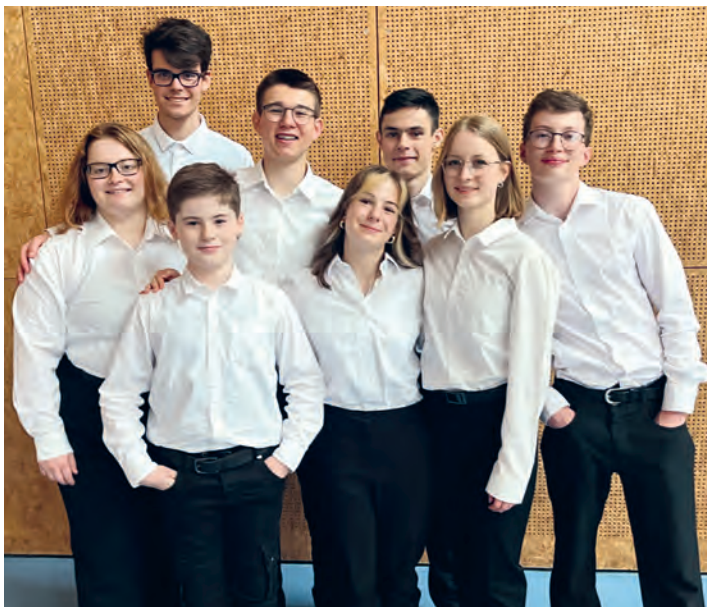
Teilnehmer am U18-Lager (vlnr):

Herzlichen Dank: Bei der Migros Aktion «Support Culture» sind insgesamt 8699 Bons auf unser Vereinskonto gutgeschrieben worden! Nun warten die Mitglieder gespannt, wieviel die Bons in Franken wert sind.