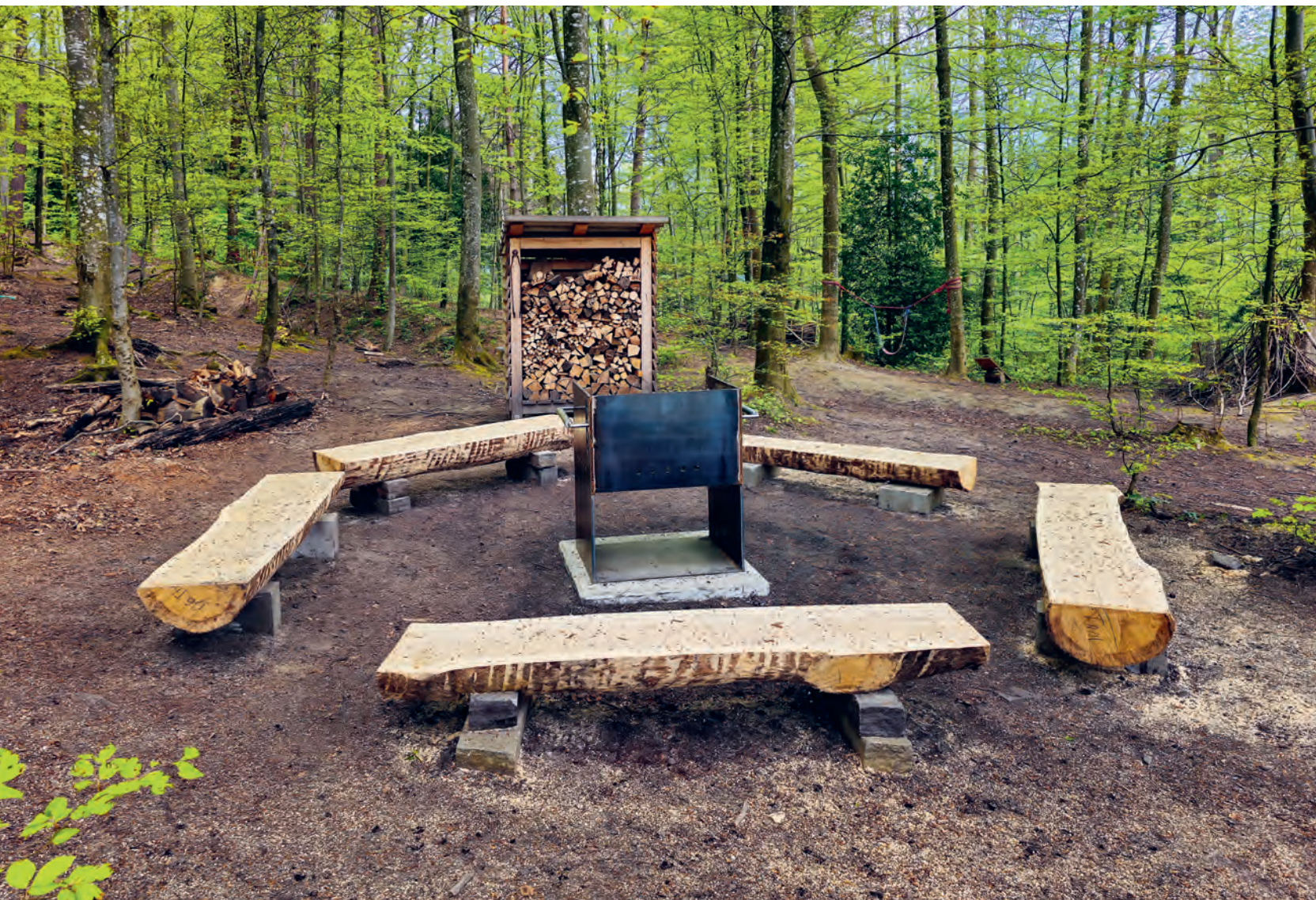
Neue Feuerstelle, nabe Seebelistrasse / Krienwald

Informationen der Politischen Gemeinde, Mitteilungen der Vereine, Aktuelles aus Thal, Staad, Buechen und Altenrhein