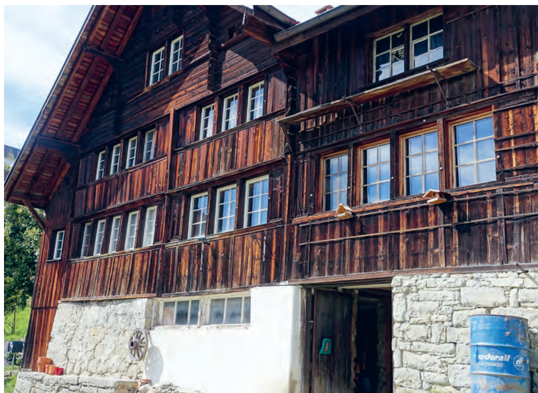
Geburtsaus des berühmten Schokoladepioniers Johann Jakob (Jean) Tobler im Weiler Tobel im Dorf Wienacht, Gemeinde Lutzenberg.

Slowakei. Noch immer aber erinnert im unter Denkmal- und Heimatschutz stehenden Weiler Tobel das altherwürdige Haus Nummer 107 an den grossen Schokoladepionier aus dem kleinen Wienacht.