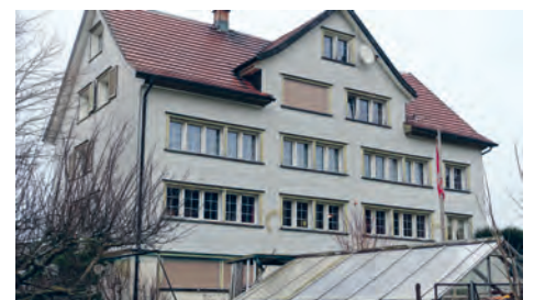
Das ehemalige Fabrikantenhaus im Lutzenberger Ortsteil Brenden hat als Seniorenwohnheim ausgedient und soll einer Überbauung mit Alterswohnungen weichen.

Eine lange gewünschte Aufwertung erhielt das Heim mit der Ende 1988 realisierten Postauto-Haltestelle unmittelbar vor dem Haus. Möglich wurde die Neuerung dank der neuen Linienführung des Postautokurses Heiden – Rheineck, der vorgängig nicht über Ortsteil Brenden verkehrte. Im Vor-sommer 2010 wurde der gut dreissig Jahre alt Lift durch einen neuen, wesentlich grösseren Aufzug ersetzt. Trotz verschiedener, in früheren Jahren erfolgter Ausbauten aber hat nun das Seniorenwohnheim ausgedient und muss Neuem weichen.