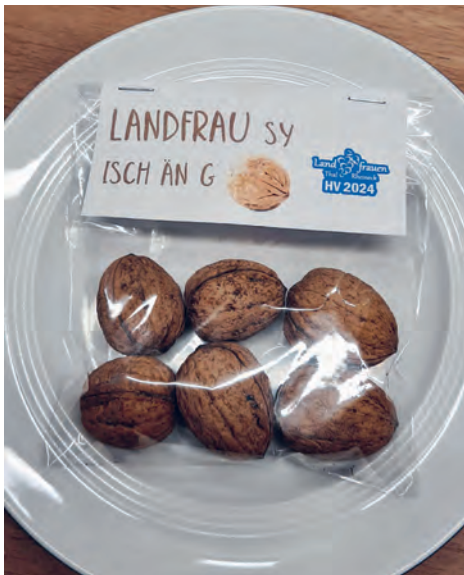
Tischdeko HV 2024

Anschließend wurde über das Jahresprogramm diskutiert und die vielen Anlässe durchgegangen, auch dieses Jahr wurde