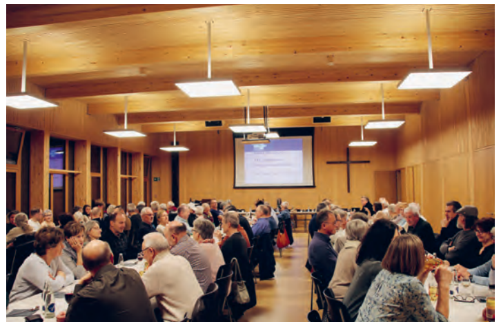
Impressionen von der HV

Die Veranstaltungen werden auf Plakaten und in den Tageszeitungen sowie auf der Homepage angekündigt. Platzreservierungen können frühzeitig auf www.donnerstags-gesellschaft.ch getätigt werden.