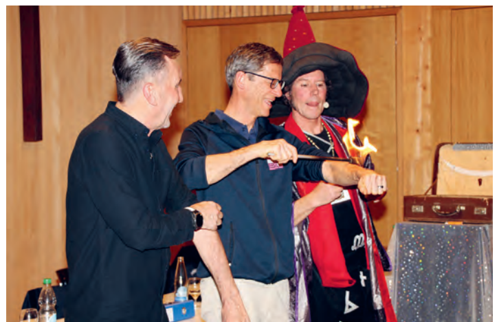
Der Alcomedian in voller Aktion