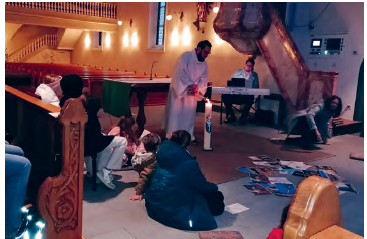
Die Kinder empfangen den Blasiussegen