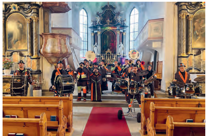
Die Guggenmusik erfreute die Gottesdienstbesucher mit fasnächtlichen Klängen.