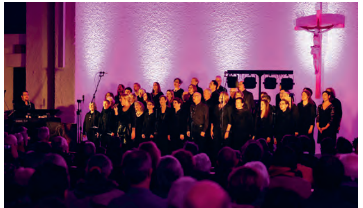
Der Gospelchor Life lud zum Konzert «Joy to the World» in die vollbesuchte Kirche in Buechen-Staad ein.