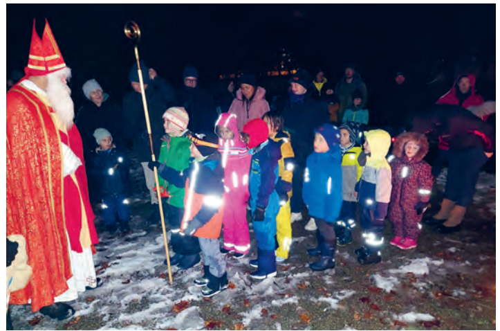
Familien waren eingeladen, den Samichlaus und den Schmutzli im verschneiten und mit vielen Kerzen beleuchteten Sefarpark zu treffen. Der Samichlaus genoss die vielen Sprüchli, Versli und Lieder, die ihm aufgesagt wurden. Die Kinder erfreute ein Samichlaussäckli.

Hast Du Freude am verkleiden? Mach mit am Umzug in Rheineck am Sonntag, 28. Januar.