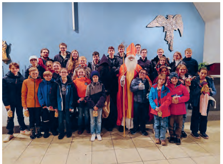
Der Preis ist heiss – hiess es am 8. Dezember. Mit Fragen rund um den Samichlaus, die Bibel, den Winter und Challenges wie Seilspringen galt es Punkte zu sammeln. Der Höhepunkt war sicher der Samichlausbesuch, der sich auch in Ihrem Namen bei den Minis herzlich für deren Einsatz bedankte.