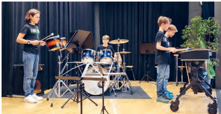
Das Ensemble TaktArt beim Auftritt am RhyContest