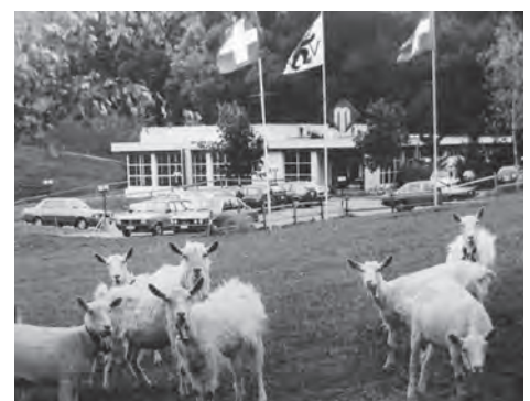
Auch eine muntere Ziegenschar freute sich im Herbst 1982 über das neu eröffnete Heilbad Unterrechtestein.

vielseitige Bade- und Saunalandschaft mit zahlreichen zusätzlichen Einrichtungen für Gesundheit, Wellness, Fitness und Schönheit. Geblieben ist der familiäre Charakter des Bades, und mit dem als Restaurant weiterbetriebenen alten «Mineralbad» bleiben die spannende Geschichte und grosse Tradition des Appenzeller Heilbades nach wie vor greifbar. ( www.heilbad.ch )