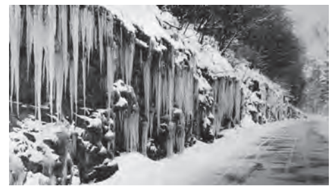
Im Februar 1942 liess an der Sonderstrasse zwischen Walzenhausen und Wolfalden eine eindrucksvolle Eiszapfengalerie staunen.

Den milden Monaten September und Oktober folgte ein bereits winterlich anmutender November, der in der Monatsmitte den ersten Schnee brachte. Ein Wärmeeinbruch hingegen war im Dezember zu verzeichnen, stieg doch die Temperatur an mehreren Tagen auf ungewohnte 16 Plusgrade. Der Gesamtschneefall im letzten 1942er Monat betrug nur gerade 4 Zentimeter.