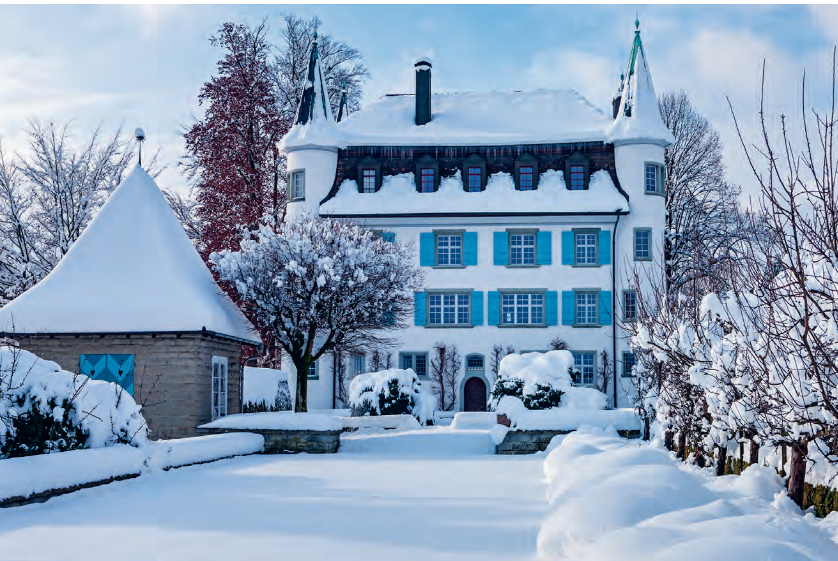
Buechen – Schloss Risegg

Informationen der Politischen Gemeinde, Mitteilungen der Vereine, Aktuelles aus Thal, Staad, Buechen und Altenrhein