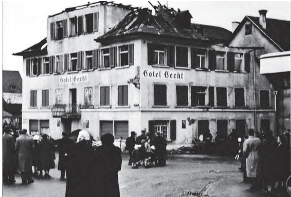
Zahlreiche Schaulustige aus der ganzen Region bedauerten vor 65 Jahren die Zerstörung des weitbekanntesten Hotels «Hecht» in Rheineck.